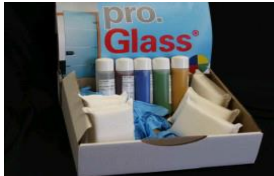
pro.Glass® Color Standard Box