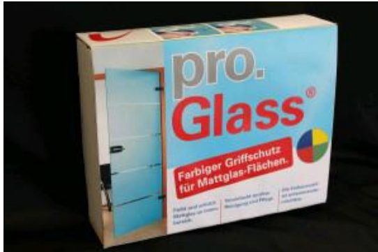
pro.Glass® Color Standard Box